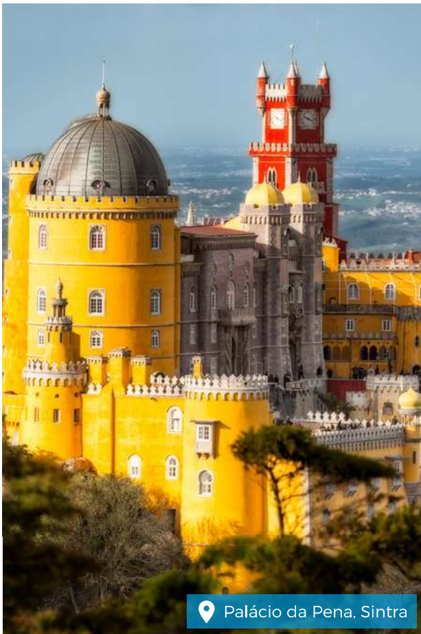
📍 Palácio da Pena, Sintra