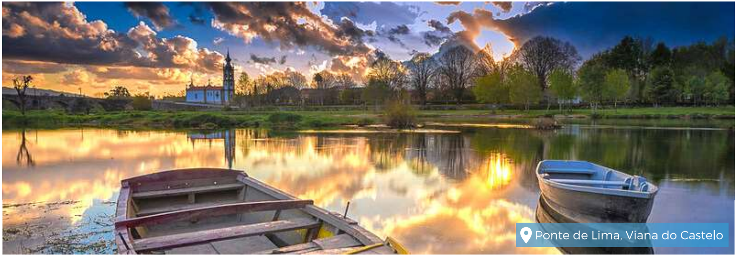
📍 Ponte de Lima, Viana do Castelo