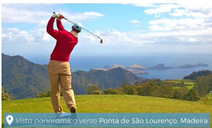
📍 Vista panoramica verso Ponta de São Lourenço, Madeira

SPA esclusive in dimore storiche immerse nel verde, selezionate per un relax perfetto.