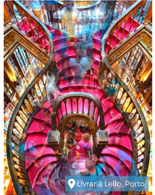
Livreria Lello, Porto