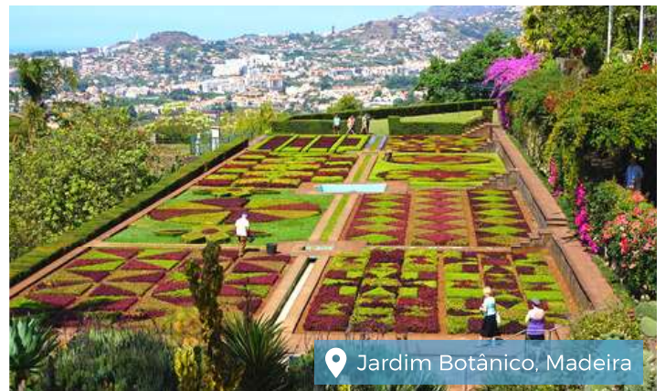
📍 Jardim Botânico, Madeira