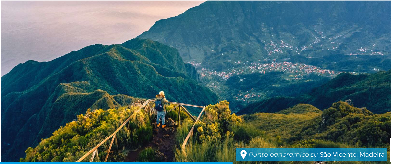
📍 Punto panoramico su São Vicente, Madeira

Il nostro lavoro è fatto di persone che si incontrano e condividono. Il nostro lavoro è fatto di professionalità, familiarità, cordialità, serietà e attenzione. Il nostro lavoro, sempre più spesso, crea relazioni che durano nel tempo, perché è molto più che comprare e vendere... È un tratto di strada fatto insieme.