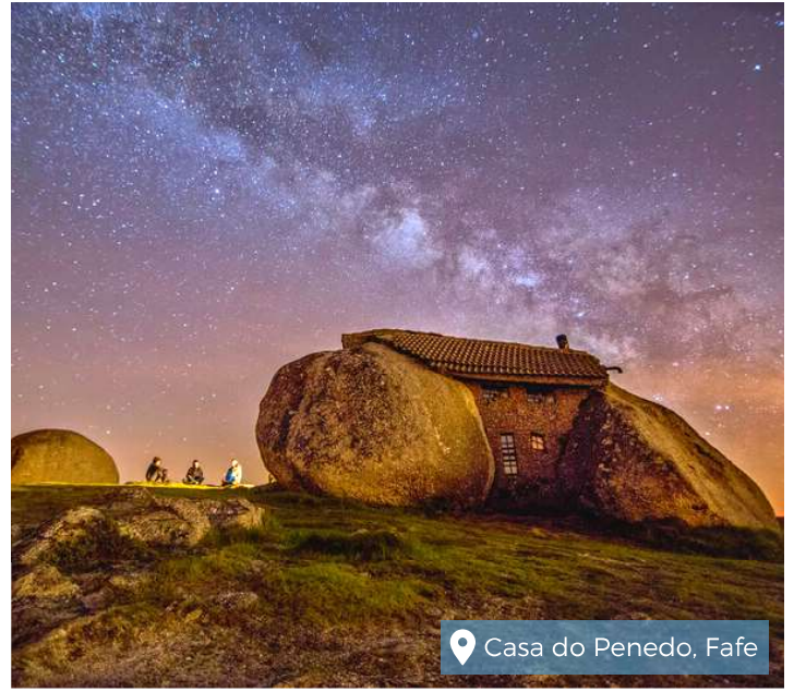
Casa do Penedo, Fafe