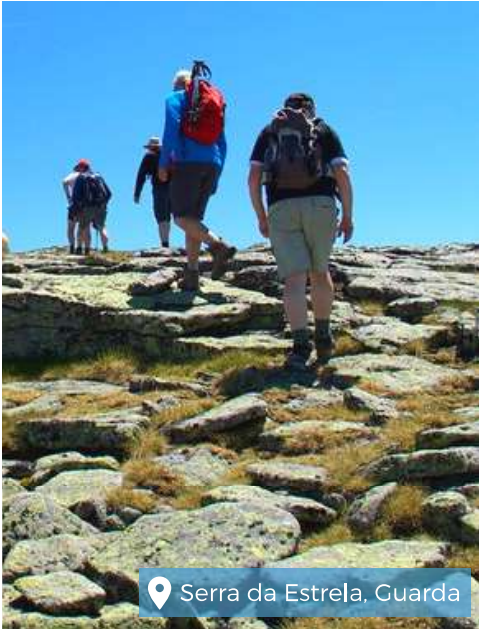
Serra da Estrela, Guarda

L'esperienza in accoglienza di gruppi, con grande attenzione a tutti i dettagli, ci consente di essere un riferimento eccellente, sia nella preparazione di pacchetti di viaggio completi - inclusi per gli appassionati di trekking, sia nell'organizzazione di escursioni individuali.