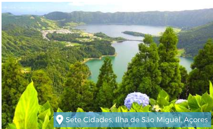
📍 Sete Cidades, Ilha de São Miguel, Açores

Le nostre guide in lingua italiana, sono esperte, accoglienti e cordiali.