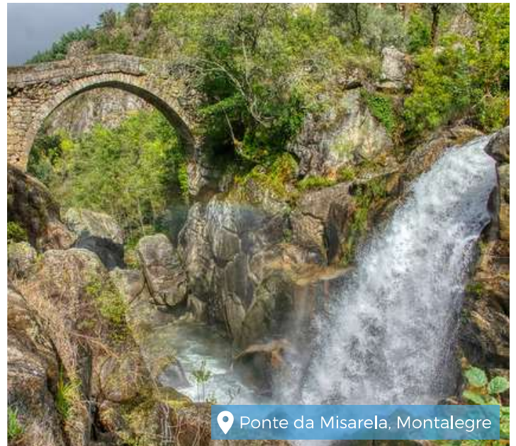
Ponte da Misarela, Montalegre