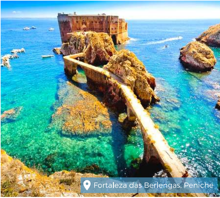
Fortaleza das Berlengas, Peniche