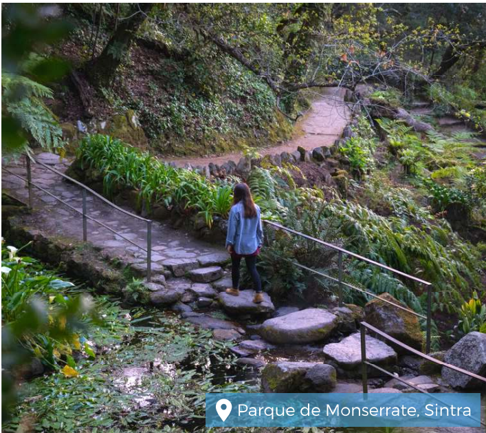
Parque de Monserrate, Sintra